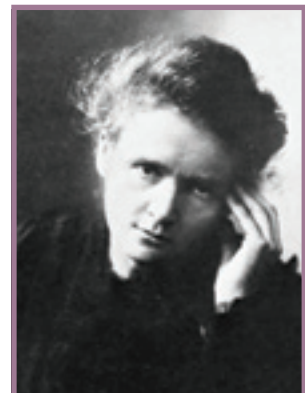
Marie Curie (1867-1934). Pionera en el estudio de la radioactividad. Premio Nobel de Física 1903 y Química 1911