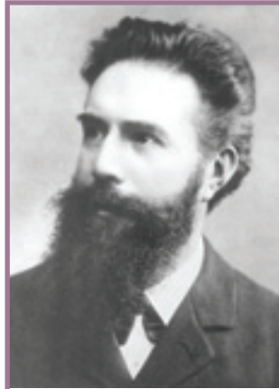
Wilhelm Roentgen (1845-1923). Descubridor de los rayos X. Primer Premio Nobel de Física 1901